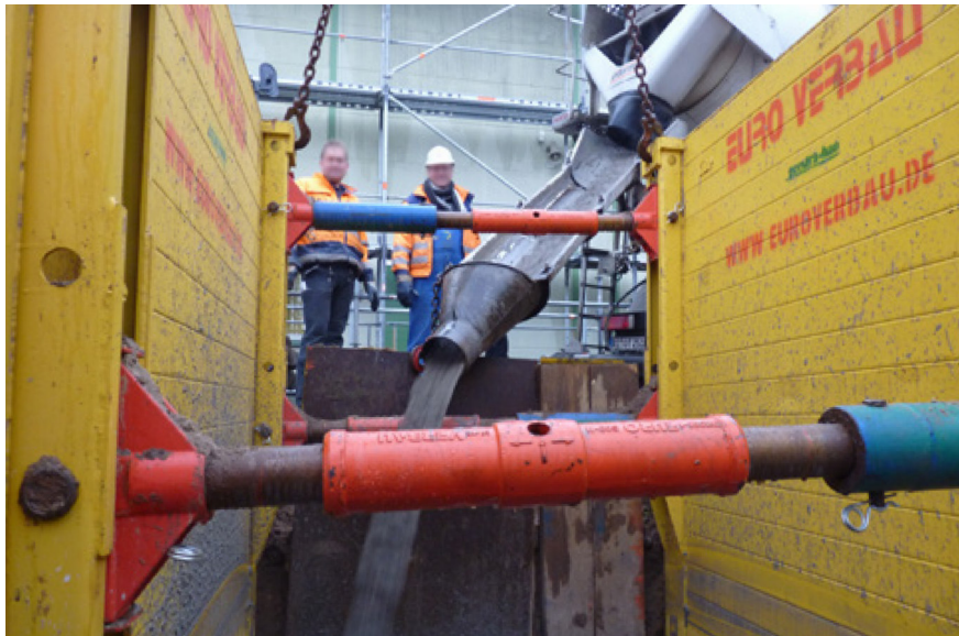
Ein typisches Einsatzgebiet: die Verfüllung von Gräben im Kanal- und Rohrleitungsbau aus dem Transportbetonfahrnischer

Ausgangsstoffe und Herstellverfahren müssen im Hinblick auf ihre Konformität mit den Festlegungen und den Anforderungen der FGSV (H ZFSV) überwacht werden. Die Qualitätssicherung muss so angelegt sein, dass wesentliche Änderungen, die die Eigenschaften beeinflussen, aufgedeckt und angemessene Gegenmaßnahmen eingeleitet werden.