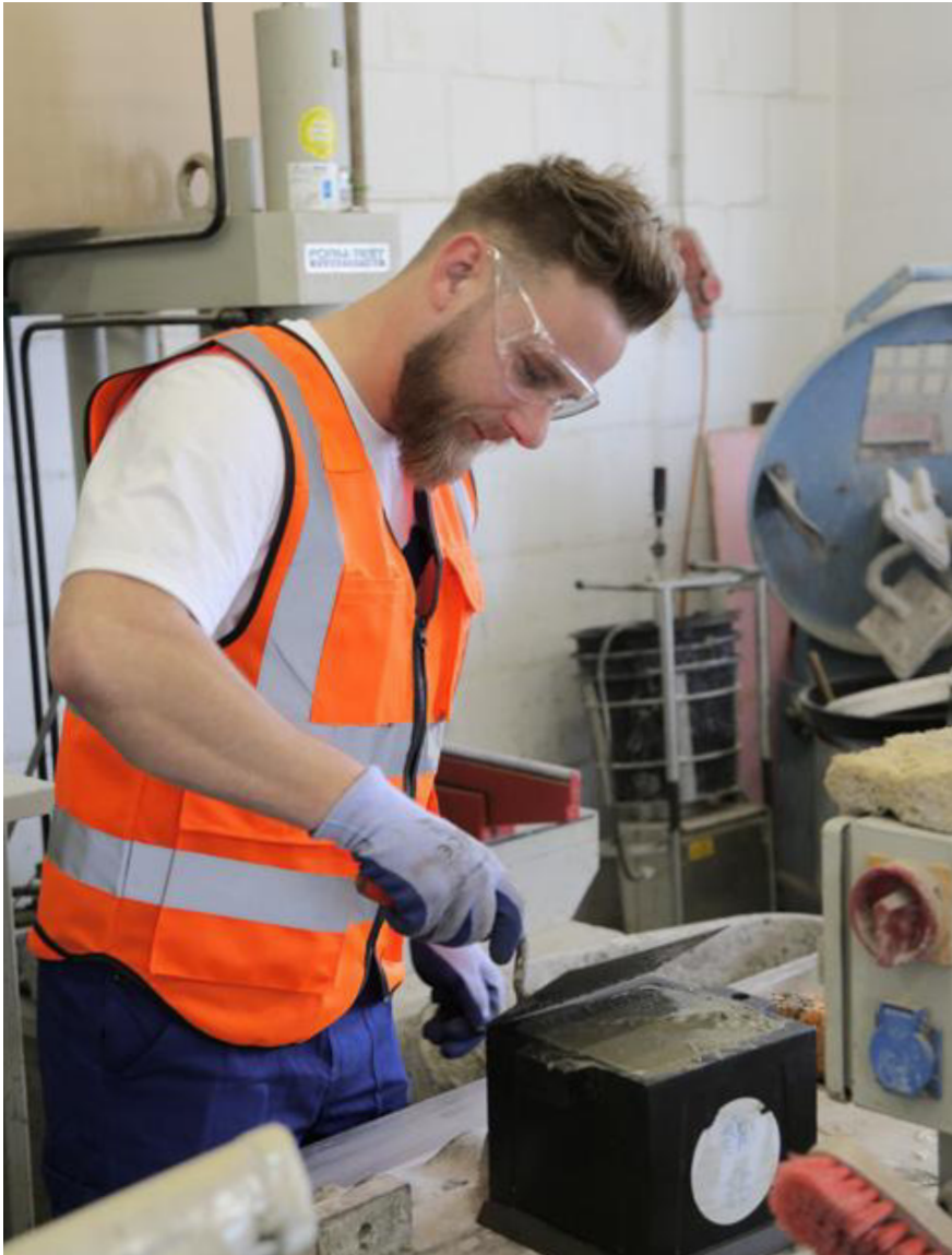
Herstellen von Probekörpern zur Prüfung der Festbetoneigenschaften

Der Flüssigboden muss homogen sein und darf sich beim Einbau nicht entmischen. Die Eigenüberwachung beim Hersteller umfasst die Prüfungen bei der Herstellung und Lieferung. Alle Prüfungen sind zu protokollieren. Art und Umfang der Prüfungen müssen der FGSV H ZFSV entsprechen. Neben den Ausgangsstoff- und Liefer-scheinkontrollen müssen in festgelegten Zeitabständen bzw. in Abhängigkeit der Produktionsmenge Frisch- und Festeigenschaften des Verfüllbaustoffs geprüft werden.