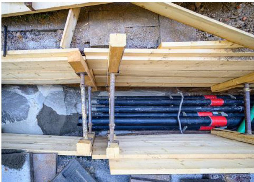
Der Verfüllbaustoff fließt in jeden Winkel der Baugrube und benötigt keine zusätzliche Verdichtung

Ausgangsstoffe und Herstellverfahren müssen im Hinblick auf ihre Konformität mit den Festlegungen und den Anforderungen der FGSV (H ZFSV) überwacht werden. Die Qualitätssicherung muss so angelegt sein, dass wesentliche Änderungen, die die Eigenschaften beeinflussen, aufgedeckt und angemessene Gegenmaßnahmen eingeleitet werden.