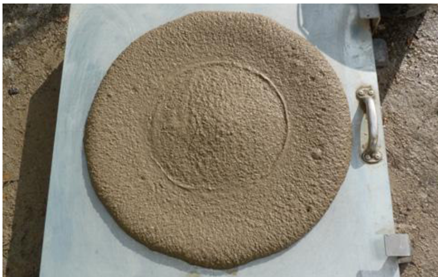
Konsistenzprüfung des Flüssigbodens