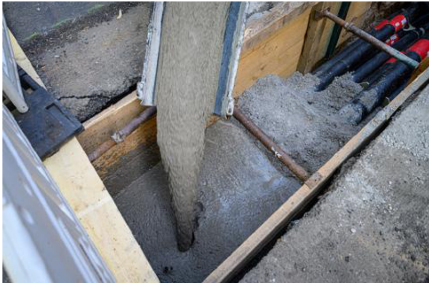
Einbau des Flüssigboden direkt aus dem Fahrmischer

Bei einer Anwendung in Leitungsgräben oder Hinterfüllungen muss eine unerwünschte langfristige Zunahme der Festigkeit des Verfüllbaustoffs vermieden werden. Das Baustoffgemisch muss so zusammengesetzt sein, dass die festgelegten Anforderungen eingehalten werden. Die Eigenschaften sind durch eine Erstprüfung zu ermitteln.